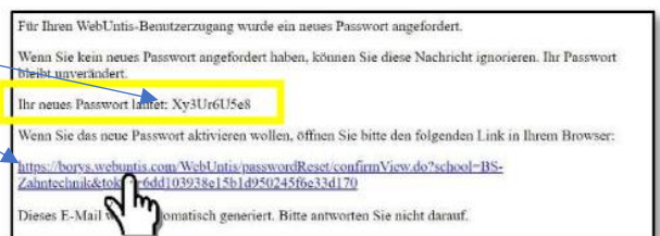
Abb. 4: Wiederherstellungsmail.